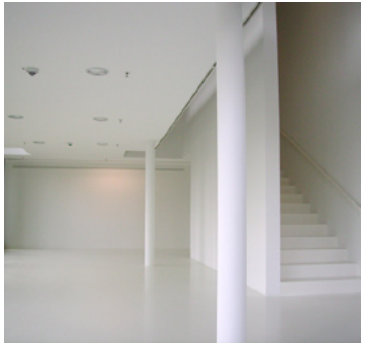
VOGES GALLERY Innenansicht Untergeschoss / Interior View Downstairs