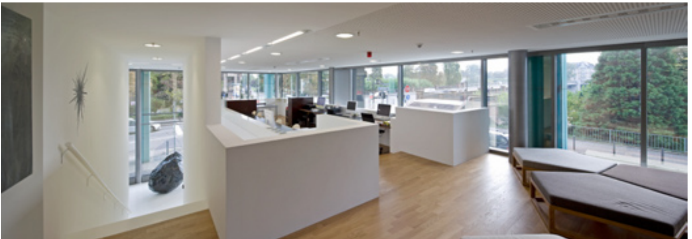
VOGES GALLERY Innenansicht Obergeschoss / Interior View Upstairs