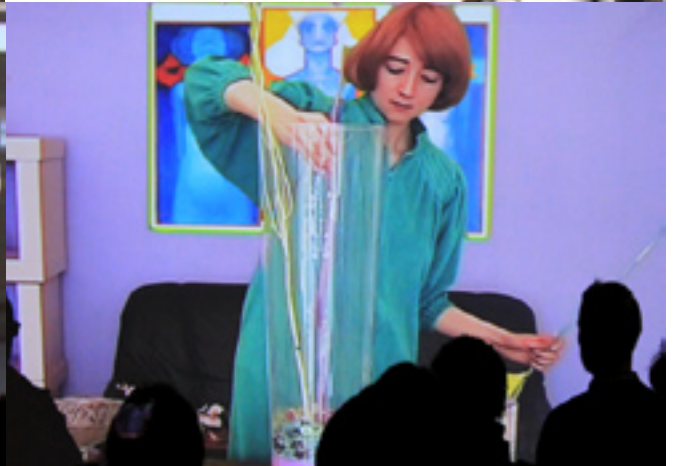
VOGES GALLERY, Konzert und Videoabend / Concert and Video Screening