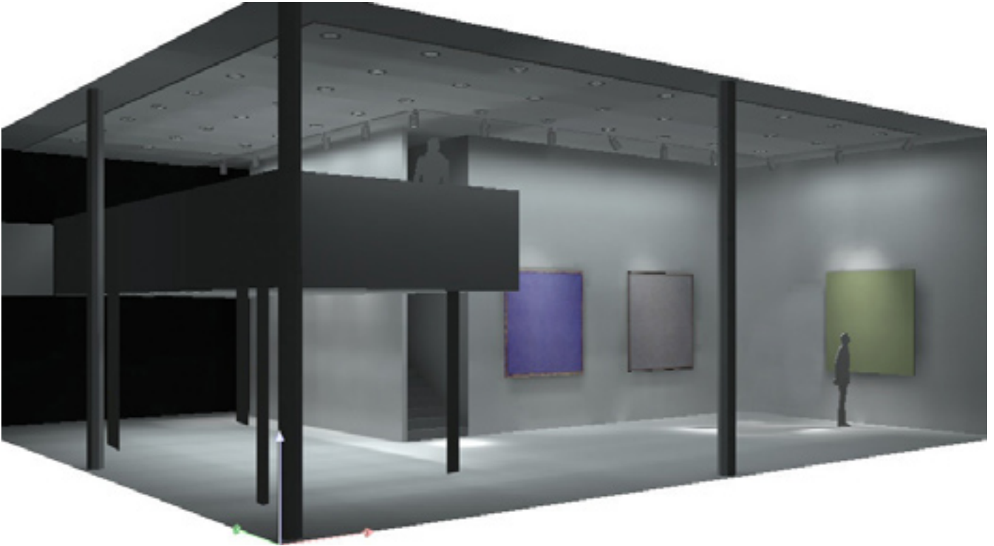
VOGES GALLERY, Innenansicht / Interior view (Rendering)